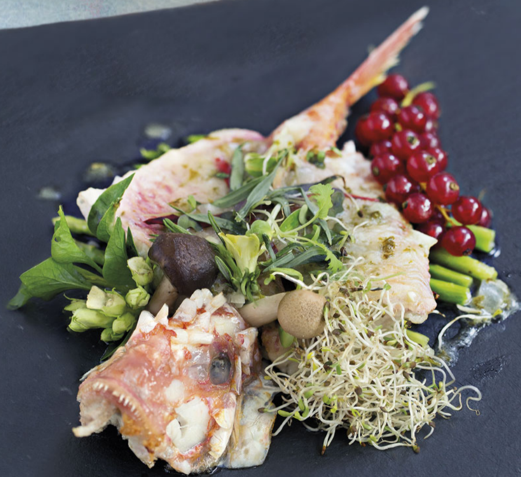
Grilled Mullet with a Reduction of Imported Lemon