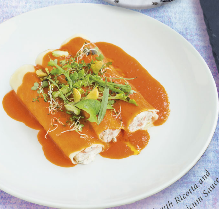
Cannellone Stuffed with Ricotta and Salmon in Red Capsicum Sauce